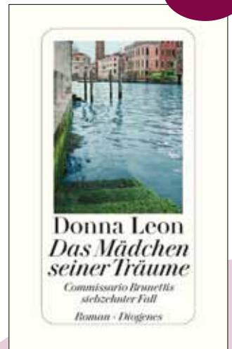
Donna Leon Das Mädchen seiner Träume Commissario Brunettis siebzehnter Fall 352 Seiten Diogenes 978-3-257-06695-1

Ein Mädchen treibt tot im Canal Grande und wird von niemandem vermisst.