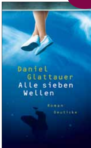
Daniel Glattauer Alle sieben Wellen 224 Seiten Deuticke 978-3-552-06093-7

Erstens: Sie kennen Emmi Rothner und Leo Leike, die sich per E-Mail rettungslos verlieben? Zweitens: Sie sind der Ansicht, dass die Liebenden zumindest eine einzige wirkliche Begegnung verdient hätten? Bitte, hier haben Sie's! Drittens: Sie haben keine Ahnung, wovon die Rede ist? Kein Problem. Hier erfahren Sie alles: von Leos Rückkehr aus Boston, von Emmis Eheproblemen und von der siebenten Welle, die immer für Überraschungen gut ist.