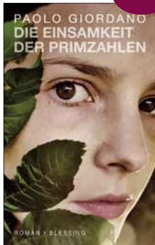
Paolo Giordano Die Einsamkeit der Primzahlen 368 Seiten Blessing 978-3-89667-397-8

In einer ebenso klaren wie poetisch-eindringlichen Sprache erzählt Paolo Giordano die Geschichte von Alice und Mattia, die wie Primzahlzwillinge nahe beieinanderstehen und doch immer durch eine Winzigkeit getrennt bleiben.