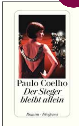
Paulo Coelho Der Sieger bleibt allein 512 Seiten Diogenes 978-3-257-06719-4

Cannes, Filmfestival, 24 Stunden: die Schönen, Mächtigen und Reichen im Scheinwerferlicht.