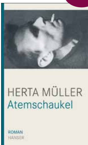
Herta Müller Atemschaukel 304 Seiten Hanser 978-3-446-23391-1

Rumänien 1945: Der Zweite Weltkrieg ist zu Ende. Die deutsche Bevölkerung lebt in Angst. Anhand des Lebens eines jungen Mannes wird vom Schicksal der deutschen Bevölkerung in Siebenbürgen erzählt. In Gesprächen mit dem Lyriker Oskar Pastior und anderen Überlebenden hat Herta Müller jenen Stoff gesammelt, der die Verfolgung Rumäniendeutscher unter Stalin in einer zutiefst individuellen Geschichte sichtbar macht.