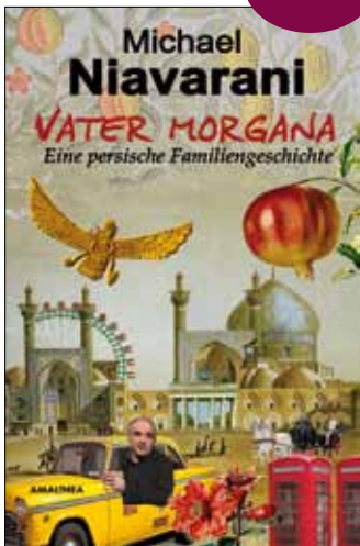
Michael Niavarani Vater Morgana Eine persische Familiengeschichte 370 Seiten Amalthea 978-3-85002-689-5

Es kann zu Verwicklungen kommen, wenn man versucht, die deutsch-österreichisch-amerikanisch-schwedisch-britisch-persische Familie endlich einmal unter dem Christbaum zu versammeln oder „Nowrouz“ – das persische Neujahrsfest zu Frühlingsbeginn – gemeinsam zu feiern. Es kann schon kompliziert werden, alle Cousins und Cousinen, Tanten und Onkel in den Sommerferien zu besuchen ...