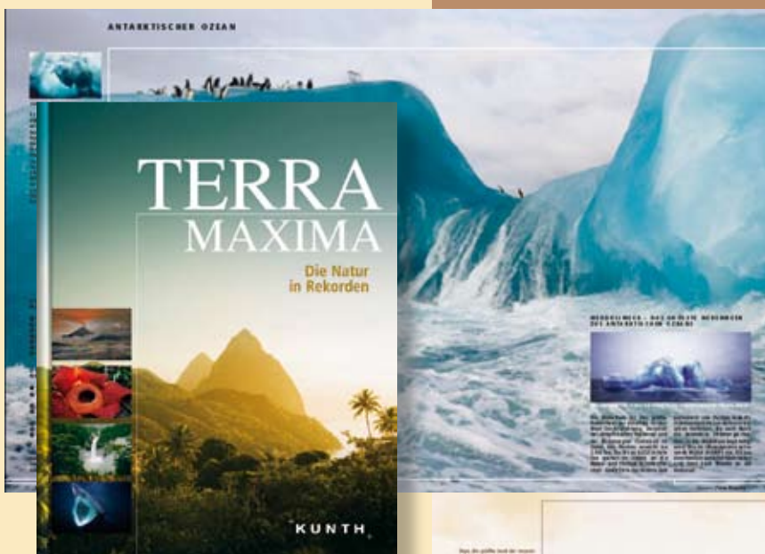
Terra Maxima. Die Natur in Rekorden Großformat, 560 Seiten, über 1.000 spektakuläre Fotos. Kunth € 41,10 | ISBN 978-3-89944-547-3 Erscheint Ende November

Das jährlich erscheinende und immer auf den neuesten Stand aktualisierte Werk listet als eindrucksvolle Bildenzyklopädie alle Stätten des Welterbes auf, beschreibt ihre Entstehung und geschichtliche Entwicklung und zeigt ihre weltweite, einmalige Bedeutung auf. Alle Monumente sind bebildert, und nach Kontinenten gegliedert lernt der Betrachter die UNESCO-Monumente in ihrem geografischen, historischen oder religiös-weltanschaulichen Zusammenhang zu verstehen. Ein Kartenteil mit Lageangabe der Erbestätten ermöglicht eine rasche geografische Lokalisierung.